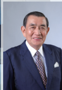
中央大学名誉教授

1973年生まれ。 東京大学経済学部卒業。 大手総合商社木材建材部勤務の後、 外資系生命保険会社営業職を経て、全国 240店舗(当時)を展開する保険代理店 事業に経営者として従事。 2017年7月東京都議会議員に初当選。 都民ファーストの会 政務調査会長代行 東京都議会 財政委員会 理事